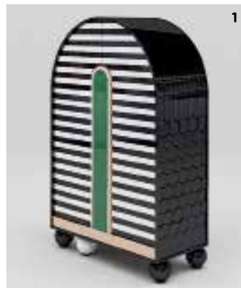
1. Шкаф Egocentric. 2. Кровать Мопасо. 3. Светильник, колл. Butterfly. Всё — Todd Merrill Studio.

Российский дизайнер с мировым именем. Член международных организаций IAD, ICSID, IFI, ICOGRADA. Член союза дизайнеров РФ. Выпускница Уральской академии архитектуры и искусств, а также британского университета Хаддерсфилд. В 2008 году основала собственную дизайн-студию. В ее портфолио — коллекции мебели и светильников. Лауреат престижных профессиональных премий Red Dot, A'Design Award & Competition, Design and Design International Award, Favorite Design, Eurasian Prize и других. Ее предметы представляет американская галерея Todd Merrill Studio. elizarova.com