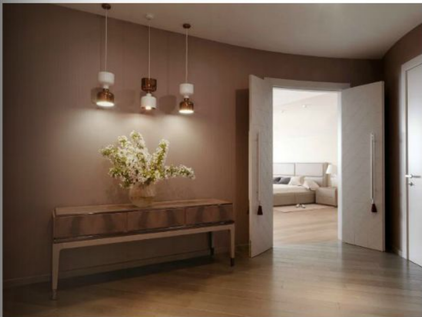
1-2. Холл: консоль Smanla вазы Natuzzi подвесные светильники Bosa by Ekaterina Elizarova зеркало по авторским эскизам

www.rzenci.it www.natuzzi.com www.elizarova.com